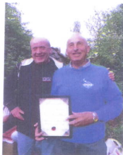
Fra utdelingen 4. juli.