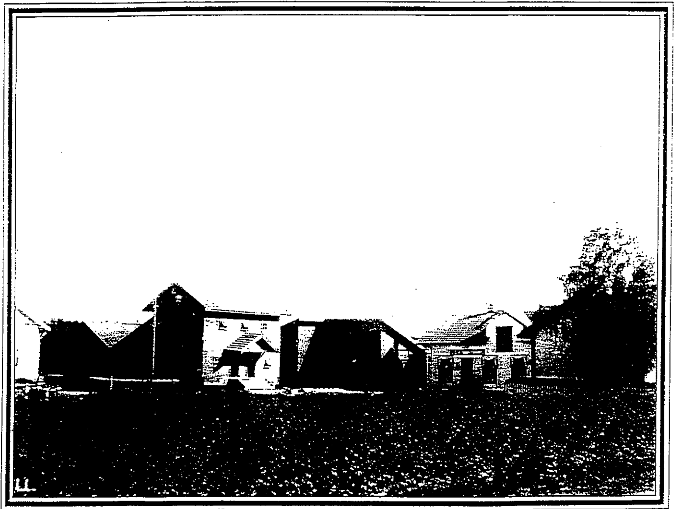
ØYERUDKRYSET mot Trøgstad m/Øyerud Landhandel ca. 1910